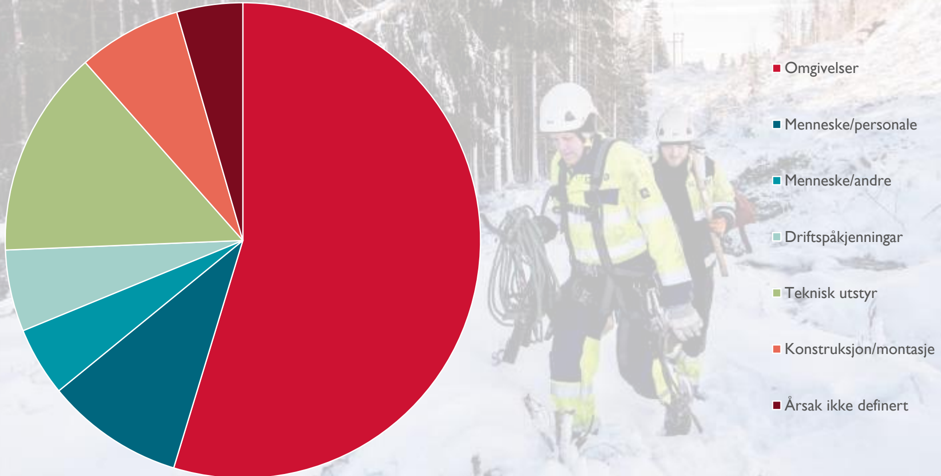
Feilårsak i regional- og transmisjonsnett