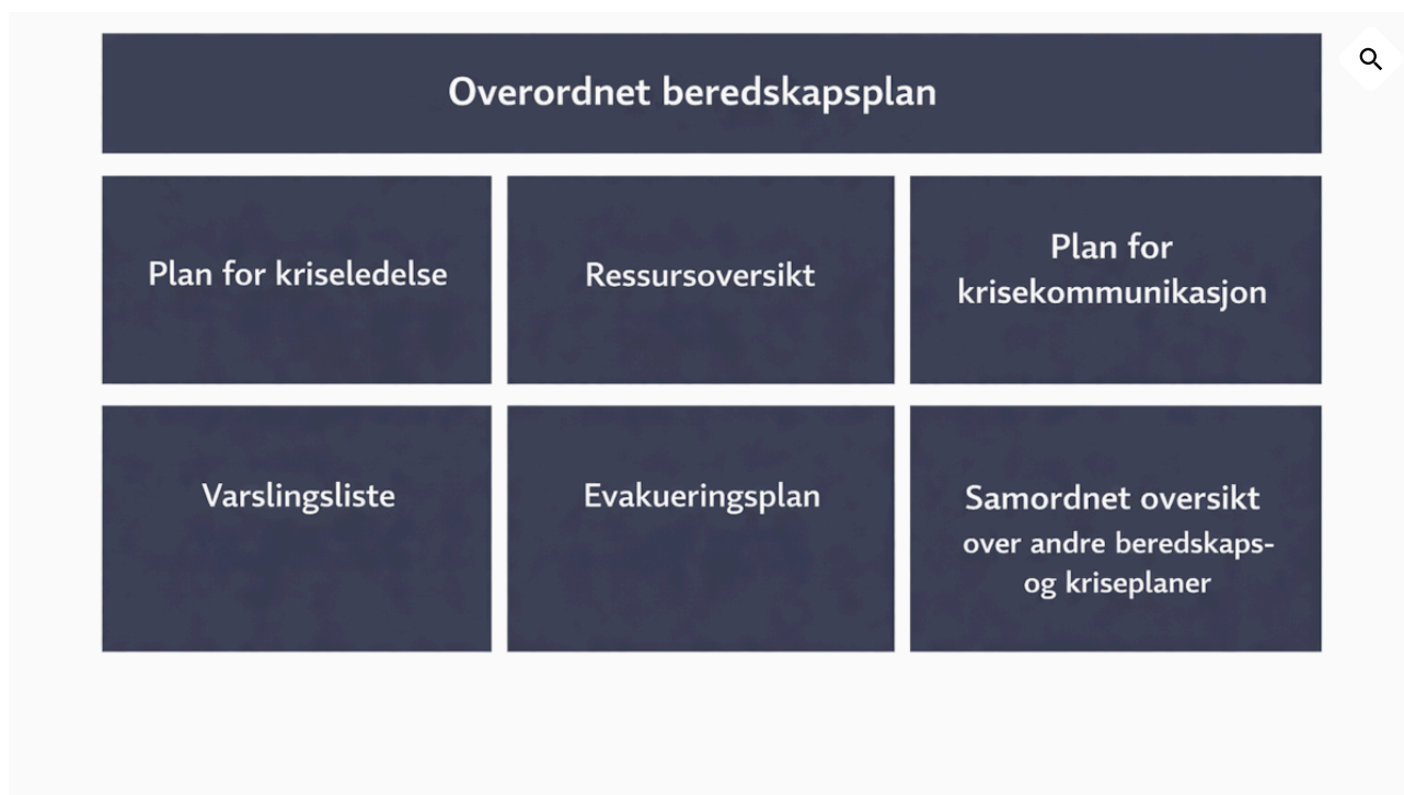
Illustrasjon: Innhold i overordnet beredskapsplan

Overordnet beredskapsplan består av seks deler: