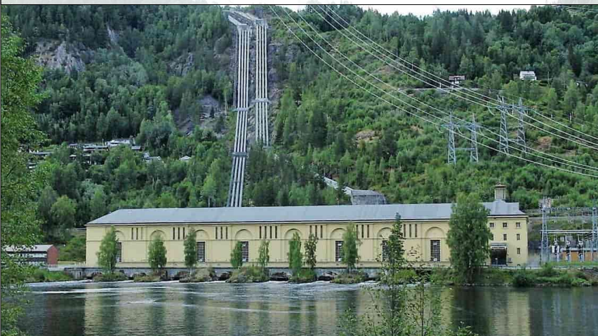
2. Robust energiforsyning