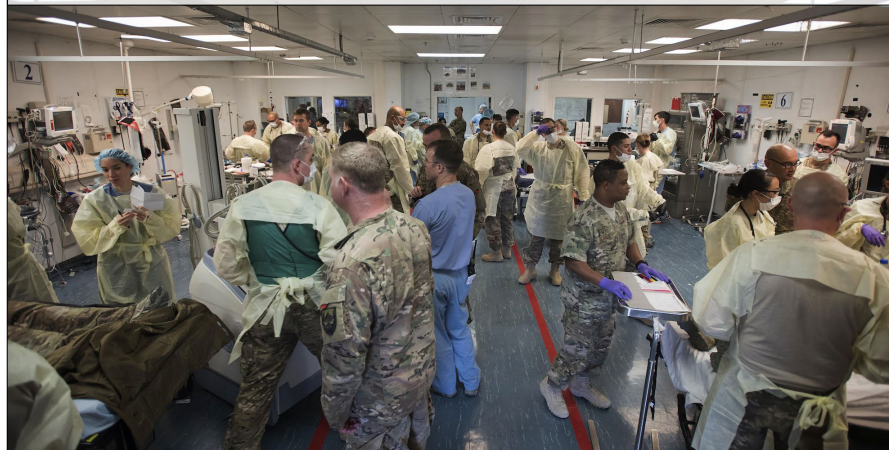
5. Evne til å håndtere masseskader og helsekriser