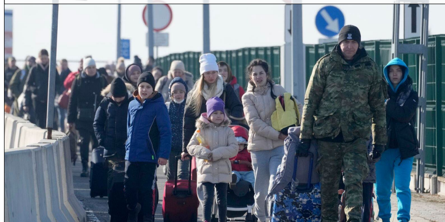
3. Evne til å håndtere store menneskemengder i bevegelse