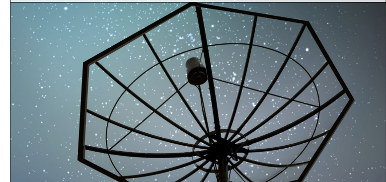
6. Robuste sivile kommunikasjonssystemer