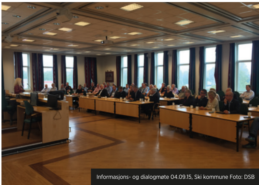
Informasjons- og dialogmøte 04.09.15, Ski kommune

Kartleggingsarbeidet, de faktiske forholdene i eksisterende bygningsmasse, og beslutninger for å sikre økonomien i prosessene, er sentrale forhold som påvirker planene for de enkelte regionene. Kartleggingsprosessen og dialogen med lokale prosjekter for 110 og 112, vil avdekke sentral informasjon for utarbeidelse av plan for gjennomføring.